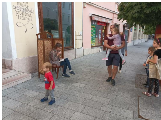
Esti mese minden hétköznap

A helyi családok és turisták nagy kedvencévé vált a Fő utcán hallható esti mese , amely szintén városi arculatot, kulturális negyed, és városhoz kötődő identitást is formál.