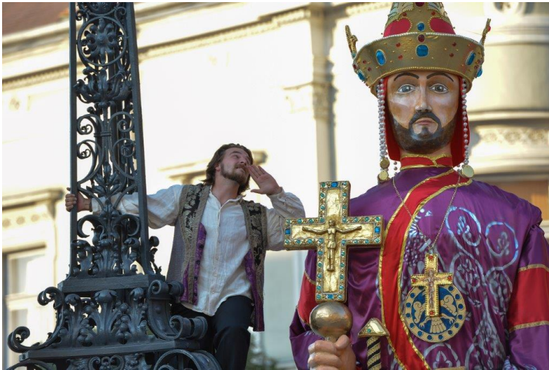
Utcaszínház, Élőképes krónika, középkori játékok