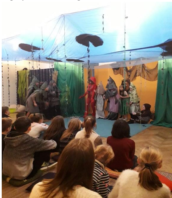
Tóvirág című gyermek előadásunk, gyermekszereplőkkel

Jelenleg három utánpótlás csoportban folyik a művészeti nevelés, tehetség gondozás, és mentorálás. E területen végzett tevékenységünket Bonis Bona elismeréssel is díjazták. A színházi, drámapedagógiai fejlesztések tipikusan színvonalas, csoportmunkára alkalmas körülményeket és elkötelezett, speciális tudással bíró, jó szakembereket igényelnek; mindezek forrásigényei azonban már nem férnek bele az egyesületi keretbe. Éppen ezért ezen a területen is pályázati lehetőségeket, és mecénásokat keres a Szabad Színház.