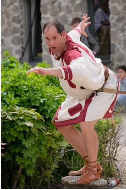
Ókori színházi előadások