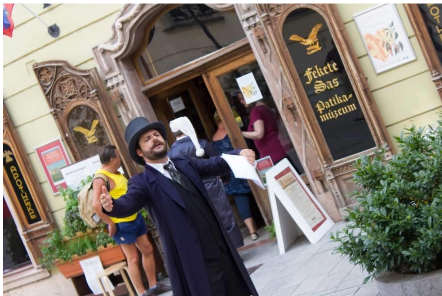
Múzeumszínház, a Fekete Sas Patikamúzeumban

EMMI működési támogatásunkat állandó munkatársaink, fő és alvállalkozó szerződés keretben foglalkoztatottak megtartására, valamint saját és meghívott társulatok előadasköltségeinek fedezésére szeretnénk fordítani, a támogatásintenzitás figyelembe vételével.