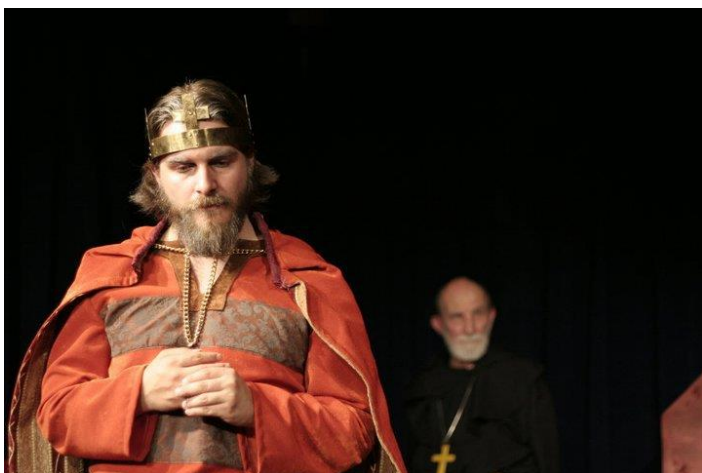
Szabadtéri történelmi drámák