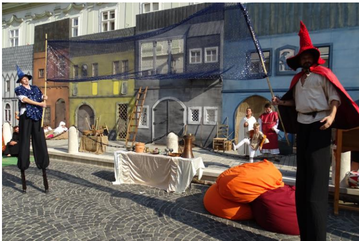
Történelmi Fesztivál-báb, tánc, zenei