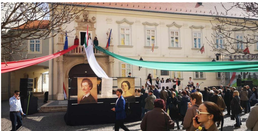
2024. március 15.