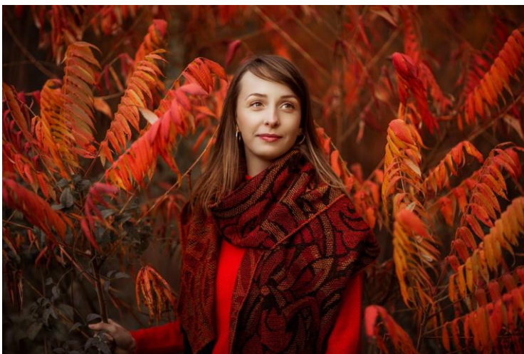
Kortárs vizuális, zenei performance-ok