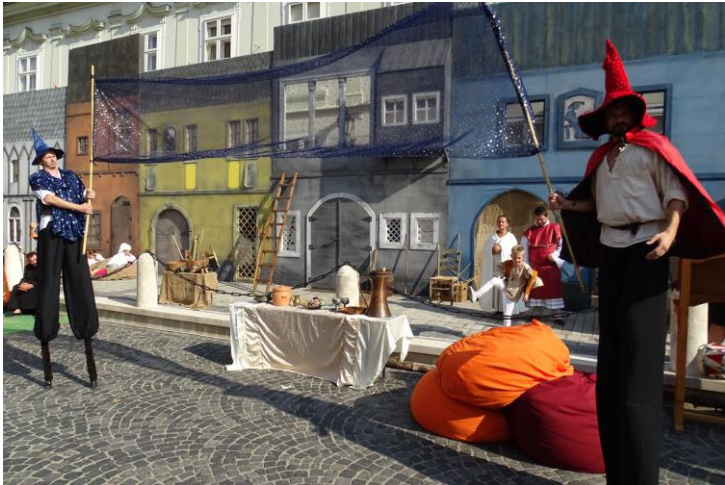
Történelmi Fesztivál-báb, tánc, zenei